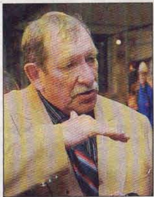
«Une deuxième étape est devant nous.»

Pour le maire de Dommartin-le-Franc et président de l'association parc métallurgique 52, «nous avons le sentiment aujourd'hui d'avoir accompli une étape. Sur le plan de l'investissement, nous avons réussi notre pari. Maintenant, cette structure, il faut qu'elle vive, il faut qu'elle fonctionne. Ce n'est pas une étape très facile. Il va falloir aller chercher les visiteurs en commercialisant certains produits, en mettant l'accent sur la communication. Nous allons essayer d'innover (...) Je suis sûr. L'outil de gestion de Metallurgic Park est déjà innovant. C'est une Société coopérative d'intérêt collectif (SCIC) qui se gère comme une entreprise privée et qui va nous permettre de