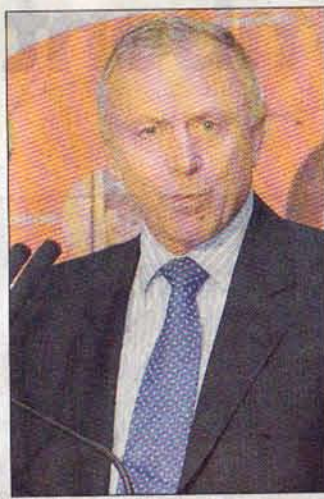
«Nous offrons les métiers les plus modernes.»

P. C. : Je leur dirais que nous avons dans la métallurgie les métiers les plus modernes. La